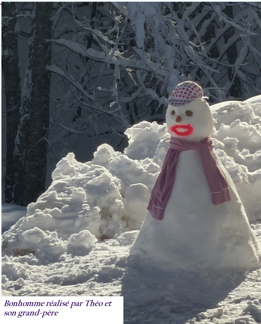
Bonhomme réalisé par Théo et son grand-père

le 16 janvier 2026 à 19h00 à la salle polyvalente de Très La Ville